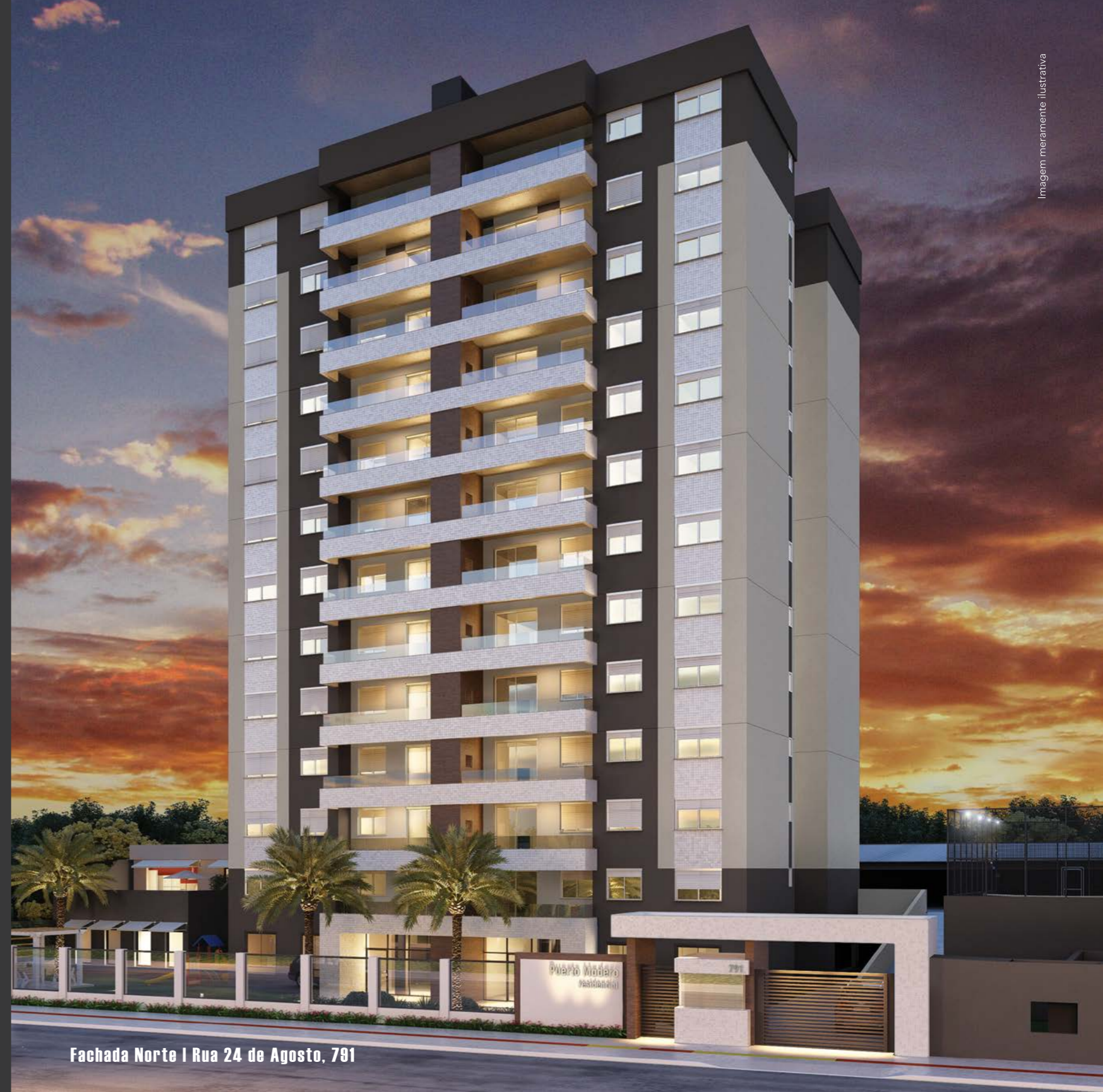
Fachada Norte | Rua 24 de Agosto, 791