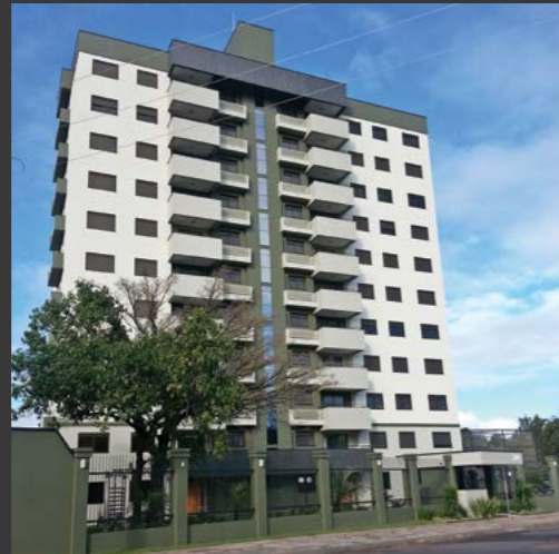
Residencial Jardins da Figueira