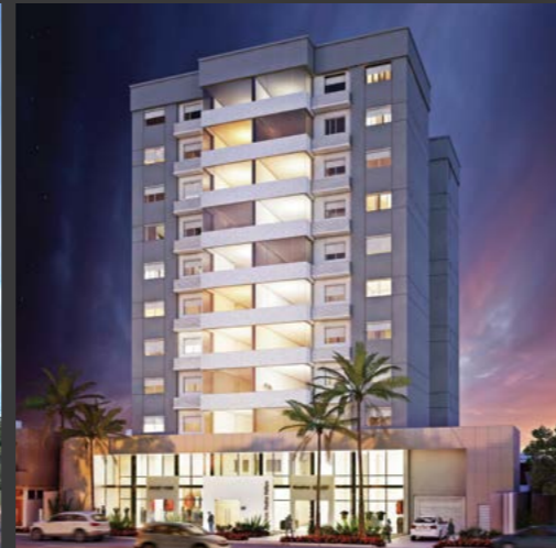
Edifício Padre Felipe 177

Designer Carine Rissi | 2ª edição | outubro | 2015